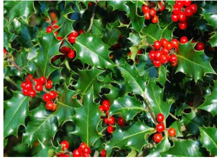
Λιόπρινα ( Ilex aquifolium )

Στολίζοντας το δέντρο, κρεμώντας τις γιρλάντες σε κάθε γωνιά, τρέχοντας στους αγρούς για να μαζέψουν λιόπρινα (φυτό με έντονο πράσινο χρώμα και κόκκινο καρπό που χρησιμοποιούμε για διακόσμηση στις γιορτές), οι πέντε φίλοι, μαθαίνουν ιστορίες και θρύλους για τις χριστουγεννιάτικες παραδόσεις των δύο χωρών.